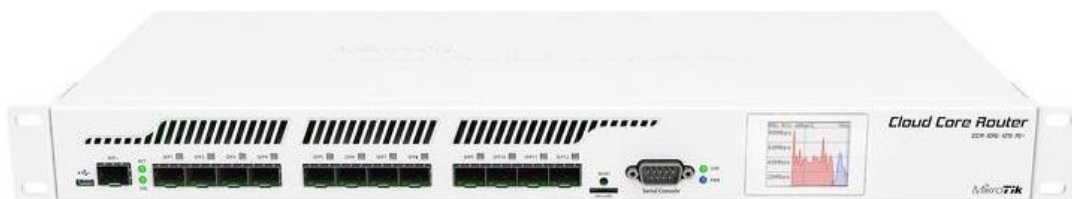
MIKROTIK CCR 1016-12S-1S+