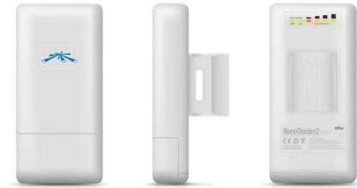
AP UBNT NANO STATION 2