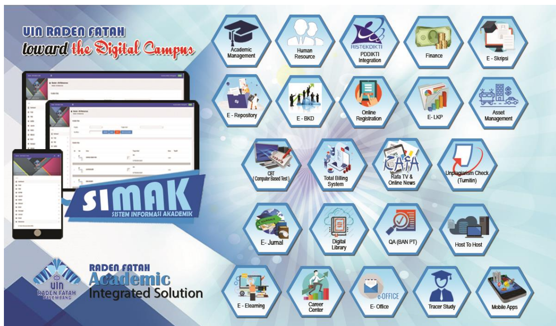
Pengembangan Aplikasi berbasis online