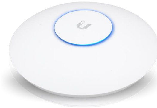
AP UNIFI AC HD