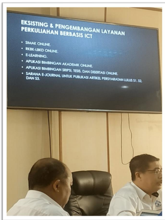
PHOTO DOKUMENTASI RAPAT EVALUASI IMPLEMENTASI LAYANAN BERBASIS TEKNOLOGI INFORMASI DAN KOMUNIKASI (TIK) 18 DESEMBER 2019